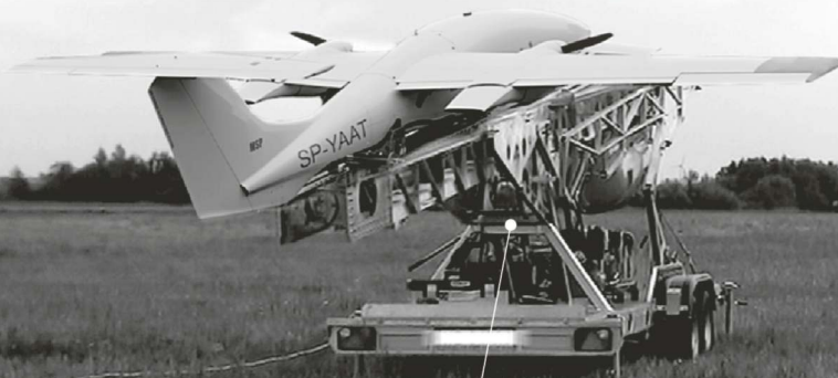
START Z WYRZUTNI PNEUMATYCZNEJ